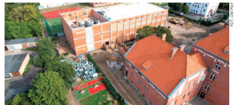
FOT. UM PILEY

Mury nowej hali sportowej przy Szkole Podstawowej nr 7 rosą w oczach. Zakres prac jest szeroki, ponieważ prócz budynku hali, inwestycja obejmuje także budowę: drogi pożarowej, wjazdu, miejsc postojowych, przebudowę powierzchni utwardzonych i bieżni oraz budowę i przebudowę instalacji elektrycznych, c.o., kanalizacji sanitarnej i deszczowej.