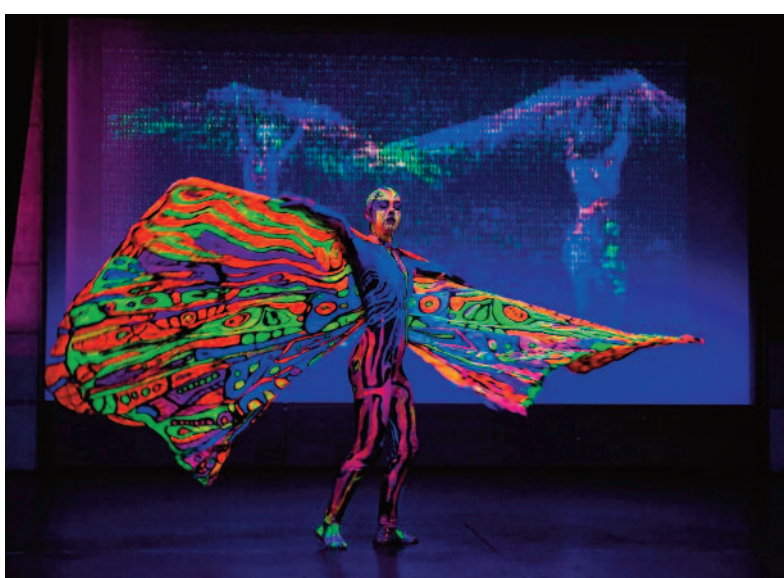
FOT. UMI PIŁY

Nie inaczej jest w przestrzeniach publicznych na terenie całego miasta. W ostatnich latach zrewitalizowany został zabytkowy Park Miejski, a także zagospodarowano w niezbędny infrastrukturę liczne skwery i tereny zielone. Bardzo ważnym ele-