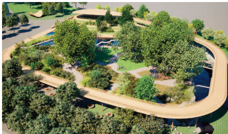
FOT. MALINOWSKIDESIGN URBAN & LANDSCAPE