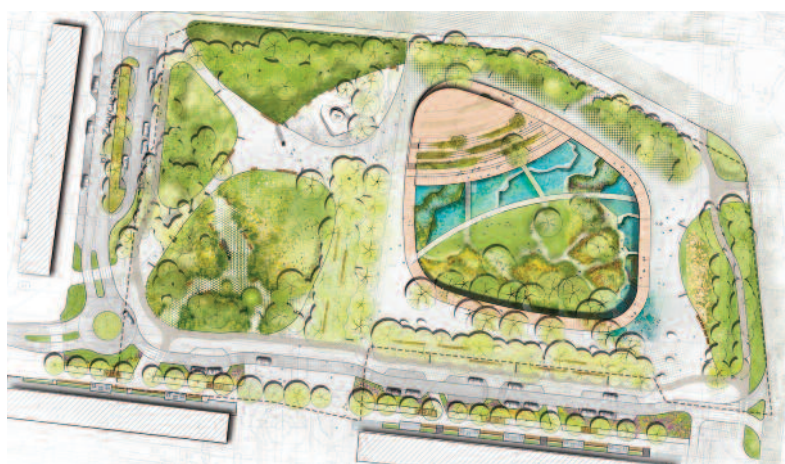
FOT. MALINOWSKIDESIGN URBAN & LANDSCAPE