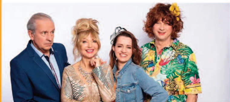
Jeśli zaczynacie dzień od lektury Instagrama i portali plotkarskich, opisujących rewelacje z życia celebrytów, to, to, co za chwilę się wydarzy, na pewno się Wam spodoba.