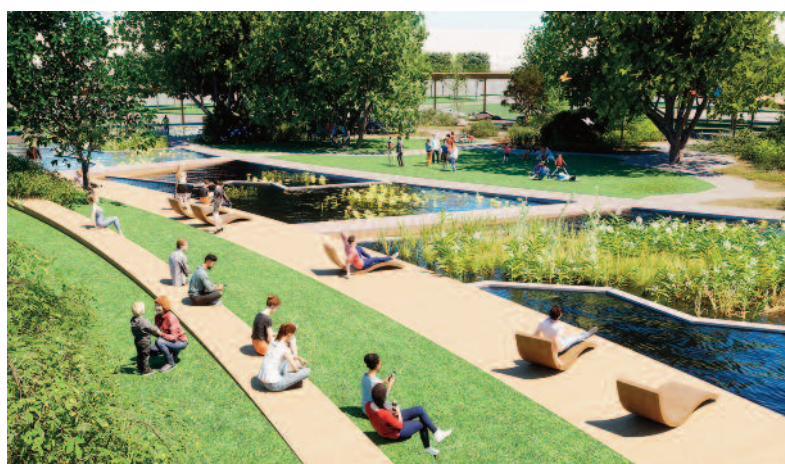
FOT. MALINOWSKIDESIGN URBAN & LANDSCAPE