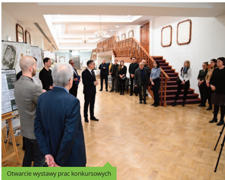
Otwarcie wystawy prac konkursowych

- Na podstawie tej koncepcji, będziemy pracować w najbliższych miesiącach nad przygotowaniem planu zagospodarowania przestrzennego, który prze-