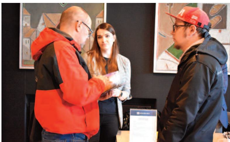
FOT. UM PIŁY