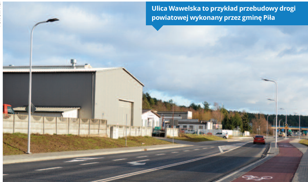
Ulica Wawelska to przykład przebudowy drogi powiatowej wykonany przez gminę Piła

Gmina Piła od dłuższego czasu proponowała władzom powiatu wspólną inwestycję przebudowy ulicy Kamiennej. Jednak mimo poniesionych wcześniej przez miasto nakładów na uzbrojenie terenu i przygotowania pełnej dokumentacji technicznej drogi należącej do powiatu, piłskie starostwo za każdym razem odrzucało propozycję gminy, by samorządy po połowie sfinansowały gruntowną przebudowę Kamiennej i zamiast bezpiecznej miejskiej ulicy, chcą przeprowadzić modernizację w znacznie obniżonym standardzie.