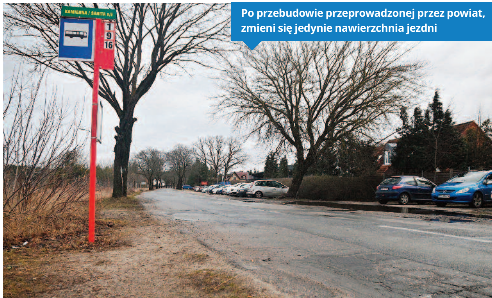
Po przebudowie przeprowadzonej przez powiat, zmieni się jedynie nawierzchnia jezdni