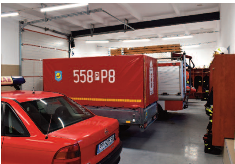
FOT. UM PIŁY